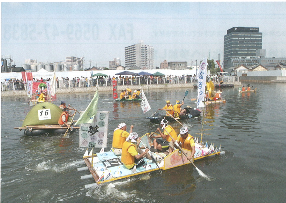
半田運河 手作りいかだレース