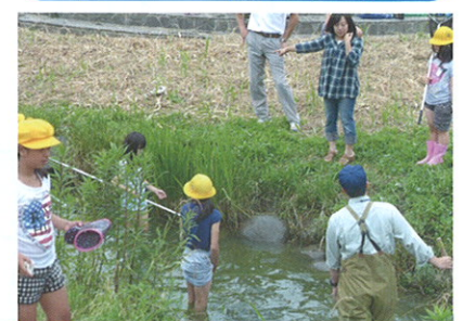
ひえだかわ 稗田川の生きもの調査