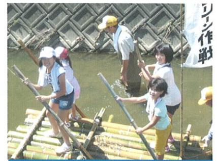
ごうどかわ 竹いかだで神戸川下り